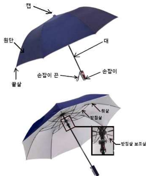
그림1 우산의 구조

3.4 고정쇠 접이식 우산을 펼쳤을 때 고정을 하기 위한 고정 장치를 말한다.